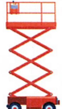
Nacelle mobile à élévation verticale