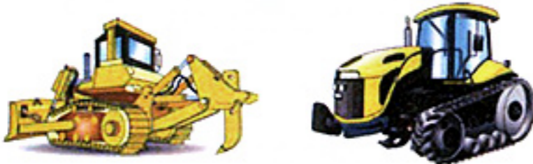
Bouteur Tracteur à chenilles