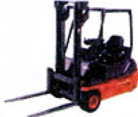
Chariot élévateur en porte-à-faux de capacité ≤ à 6 t