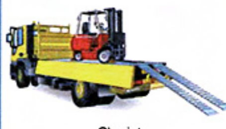
Chariot hors production, déplacement, chargement ...