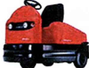
Chariot tracteur et à plateau porteur de capacité < à 6 t