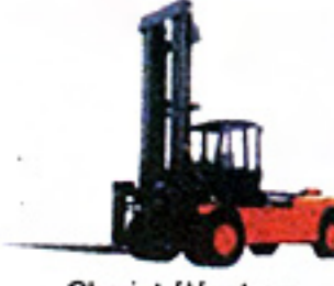
Chariot élévateur en porte-à-faux de capacité > à 6 t