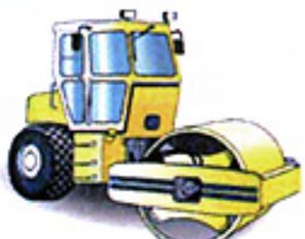
Compacteur > 4,5 t