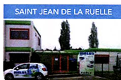
SAINT JEAN DE LA RUELLE

740 rue Louis Malbête 36130 DEOLS TEL. 02 54 222 333