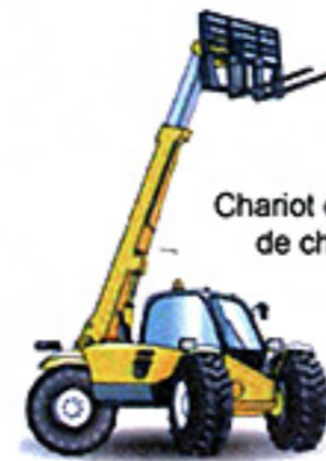
Chariot élévateur de chantier