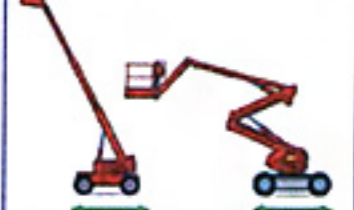
Nacelle mobile à élévation multidirectionnelle commandée de la plate-forme de travail

R408 ET R457 - ECHAFAUDAGES (montage, démontage et utilisation)