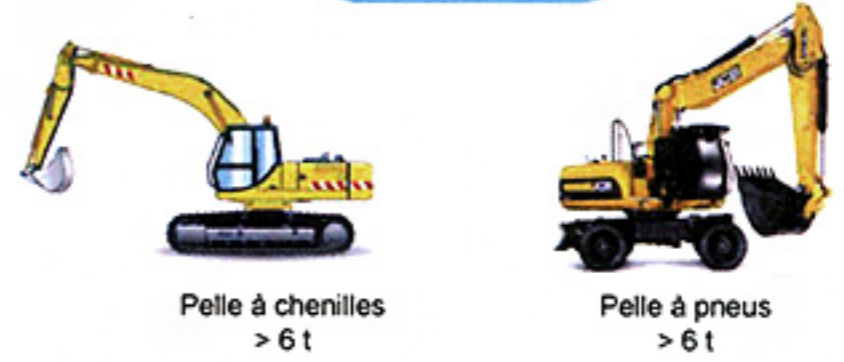
Pelle à chenilles > 6 t Pelle à pneus > 6 t