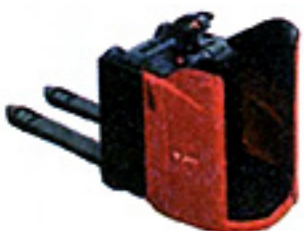
Transpalette ACP Préparateur de commande d'une levée ≤ à 1m