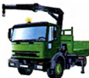
Les grues auxiliaires