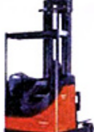
Chariot élévateur à mat rétractable