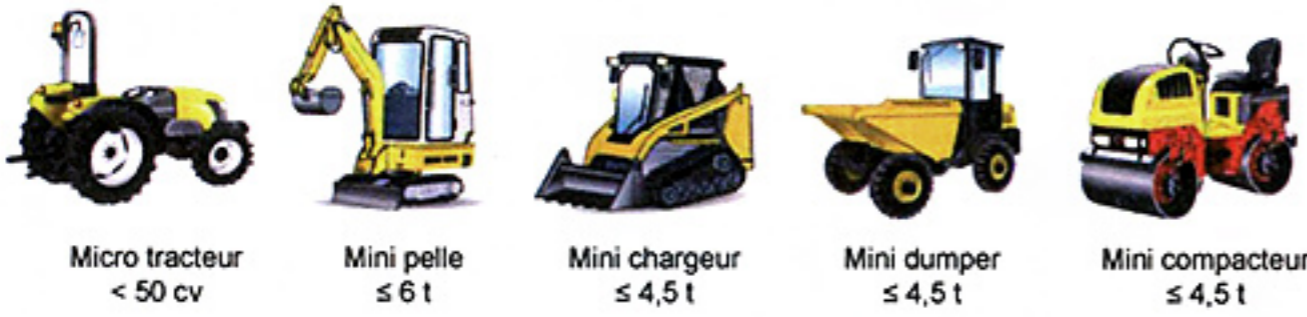
Micro tracteur < 50 cv Mini pelle ≤ 6 t Mini chargeur ≤ 4,5 t Mini dumper ≤ 4,5 t Mini compacteur ≤ 4,5 t