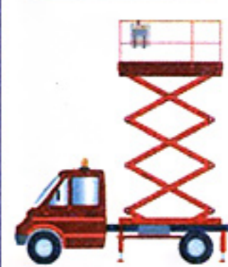
Nacelle à poste fixe avec stabilisateurs, élévation vertical.