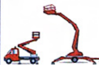
Nacelle à poste fixe avec stabilisateurs, élévation multidirectionnelle